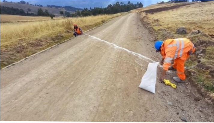
MEJORAMIENTO DE LA CARRETERA DE INTEGRACIÓN A LOS CASERÍOS DEL CENTRO POBLADO DE ATIPAYÁN DISTRITO DE INDEPENDENCIA, PROVINCIA DE HUARAZ – ANCASH