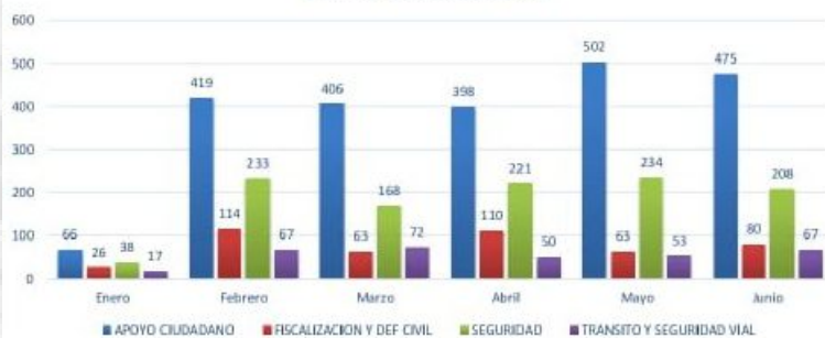
Intervenciones de Serenazgo Primer Semestre 2022